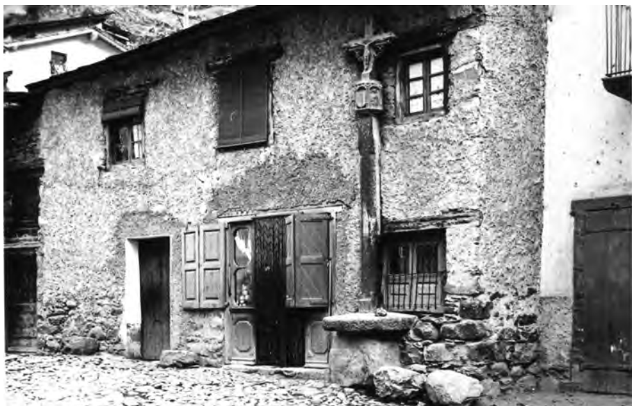
Les Escaldes, 1 d'abril del 1929