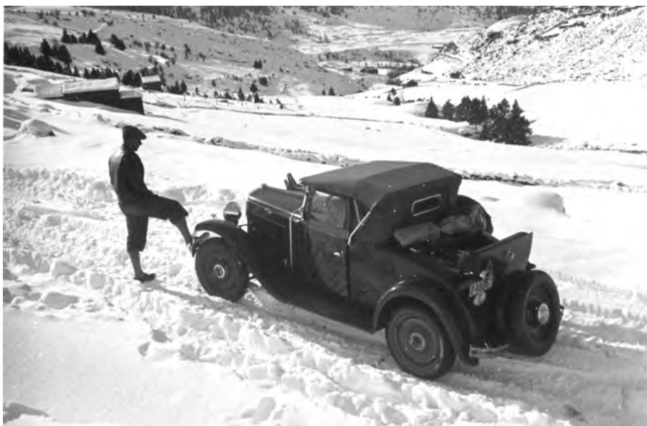
Soldeu, 25 de desembre del 1933