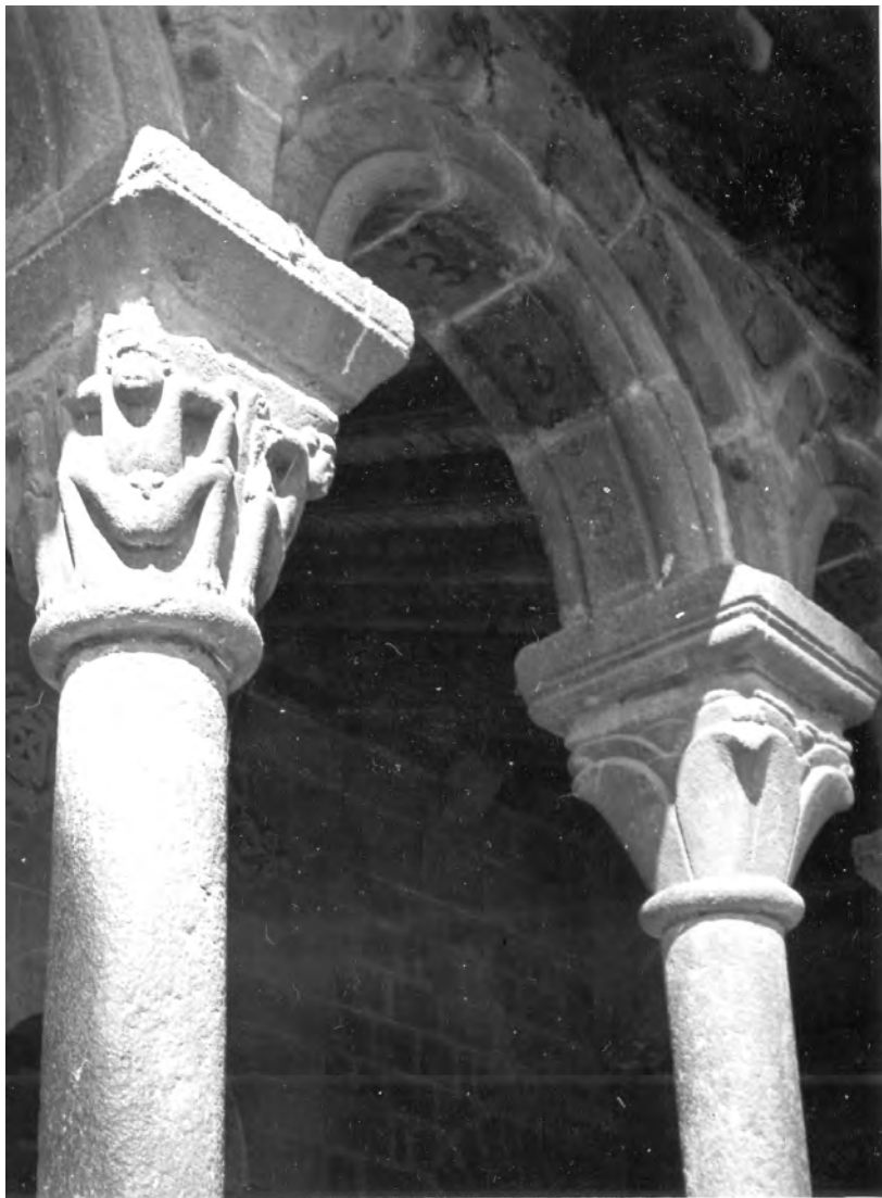
Capitells de la catedral de la Seu d'Urgell, 1 d'abril del 1929