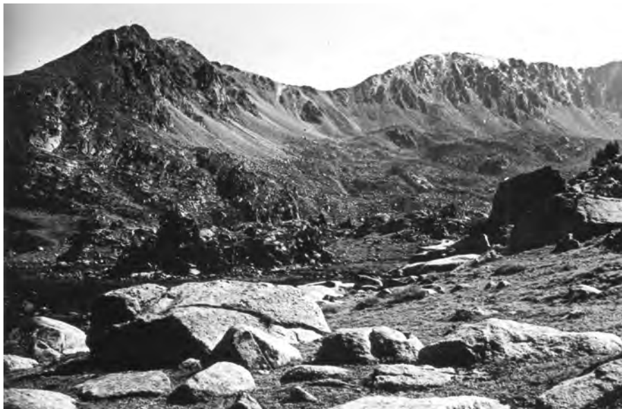
Vall del Madriu el port de Setut, 23 de setembre del 1928