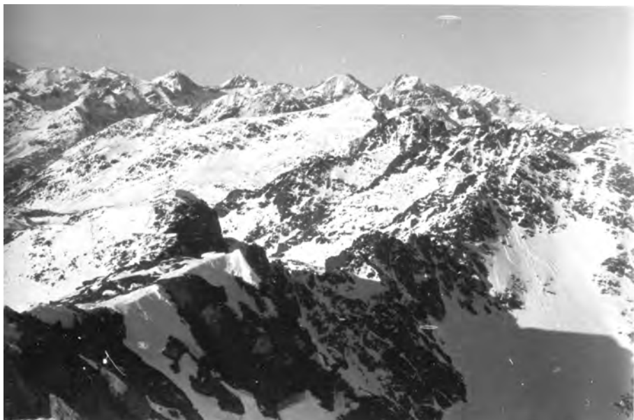
Panoràmica des del Coma Pedrosa, 24 de desembre del 1933