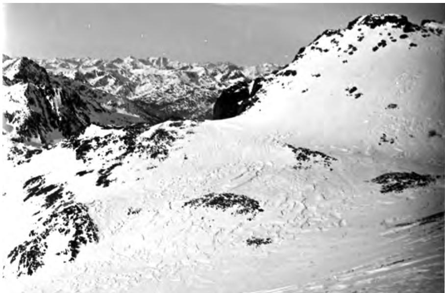
Panoràmica des del Coma Pedrosa, 24 de desembre del 1933