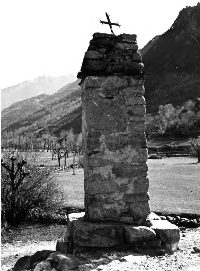
Andorra. Creu de terme, 1 d'abril del 1929