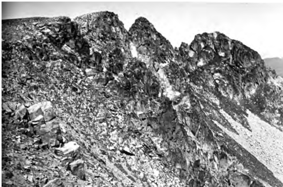
Pessons, 23 de setembre del 1933