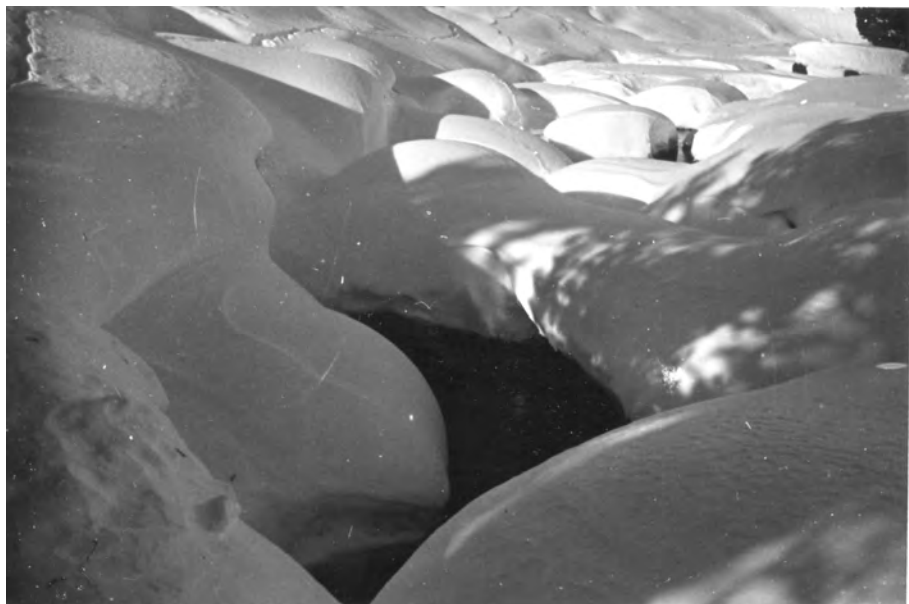
Solana de Soldeu, 25 de desembre del 1933