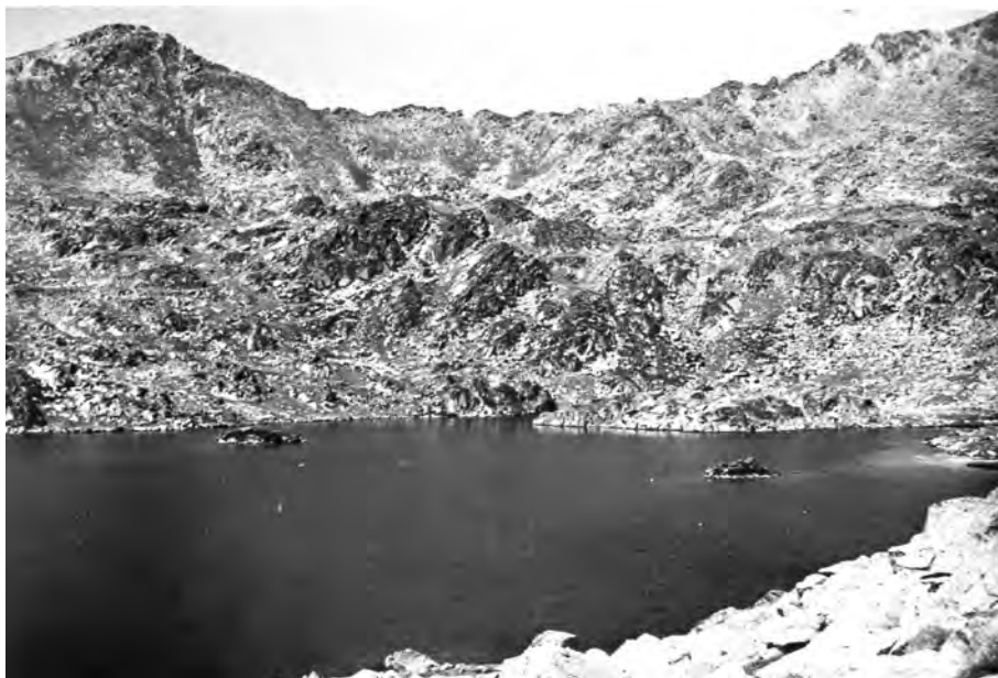
Estany de l'Illa, 23 d'abril del 1929