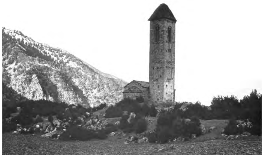
Sant Miquel d'Engolasters, 1 d'abril del 1929