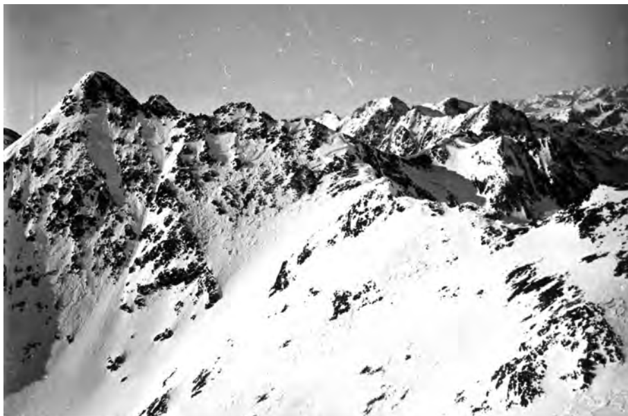
Panoràmica des del Coma Pedrosa, 24 de desembre del 1933