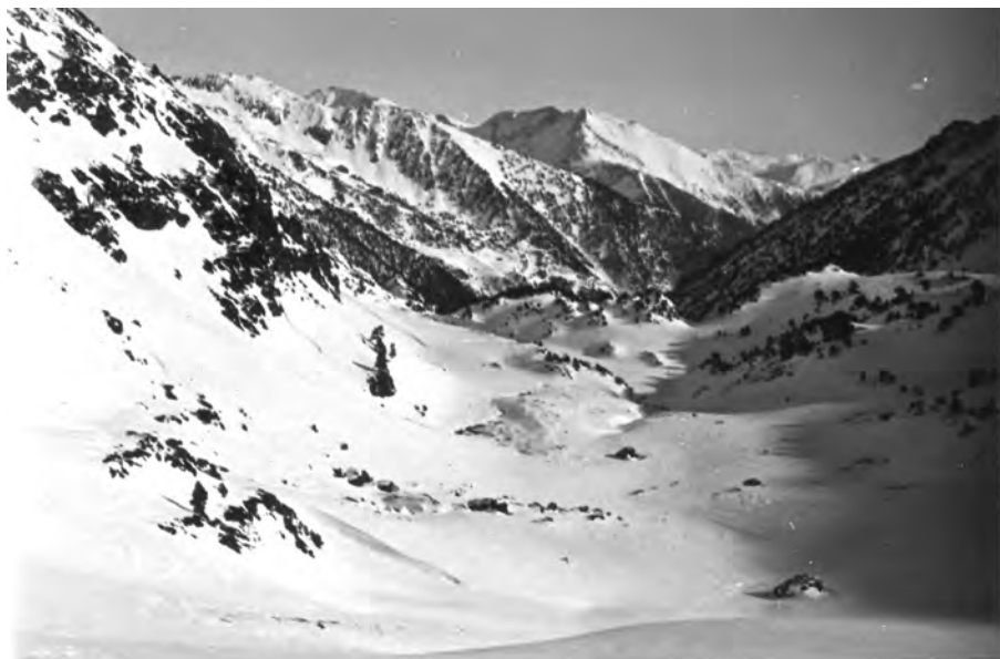
Andorra, del Pla de la Cabana vers Arinsal, 24 de desembre del 1933