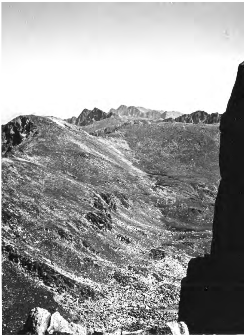
Panoràmica dels Pessons mirant el Pic Negre, 28 de setembre del 1928