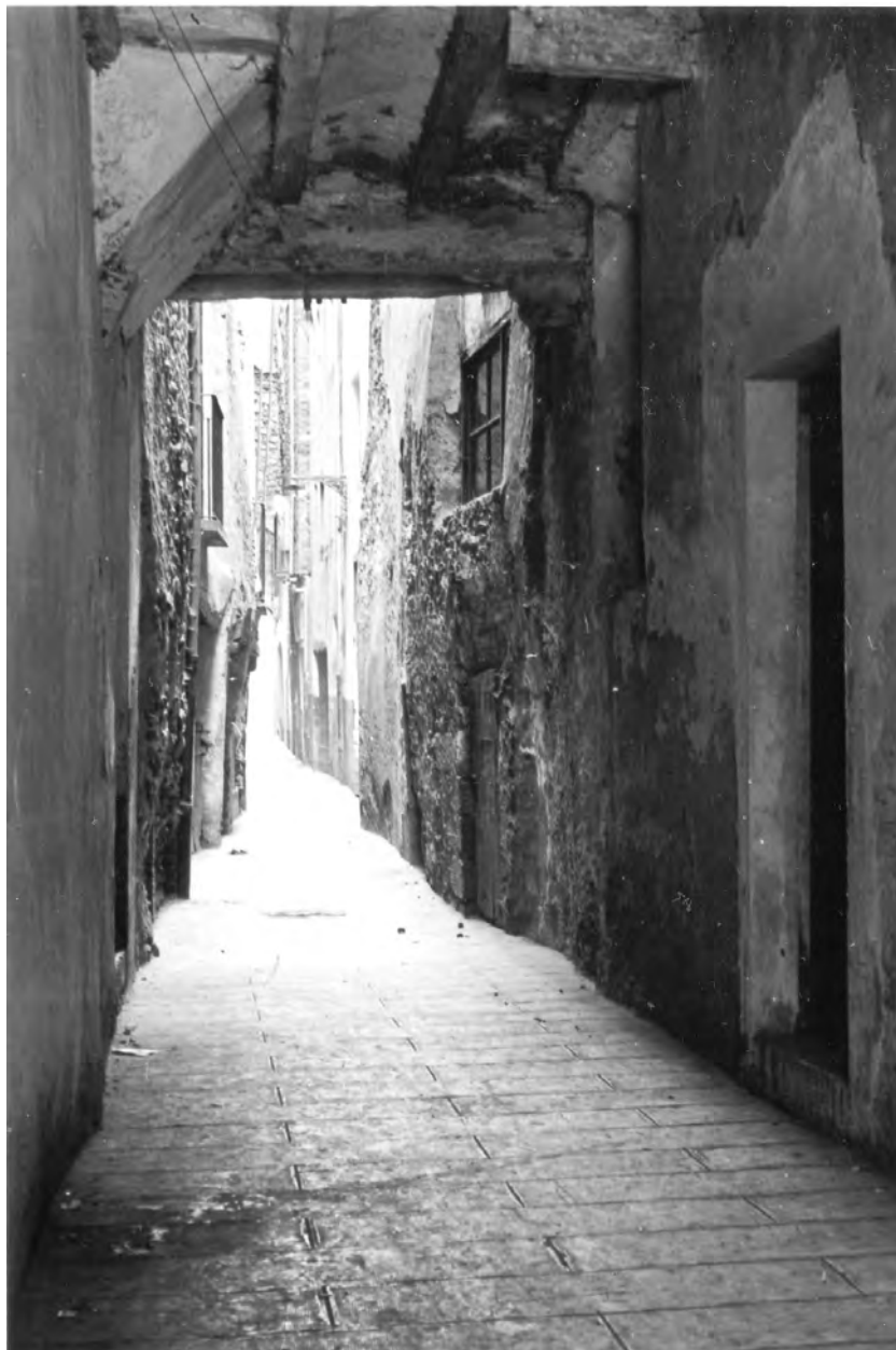
Carrer de la Seu d'Urgell, 1 d'abril del 1929