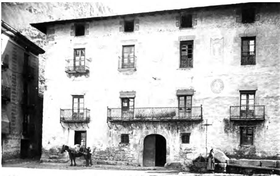
Andorra. Casa Guillemó, 24 de desembre del 1928