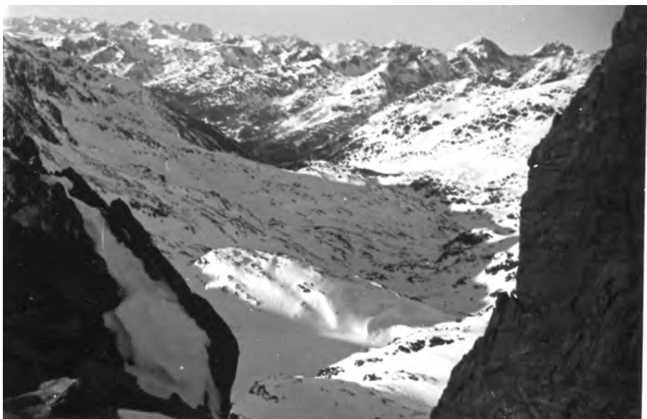
Andorra, vers Port de Boet, 24 de desembre del 1933