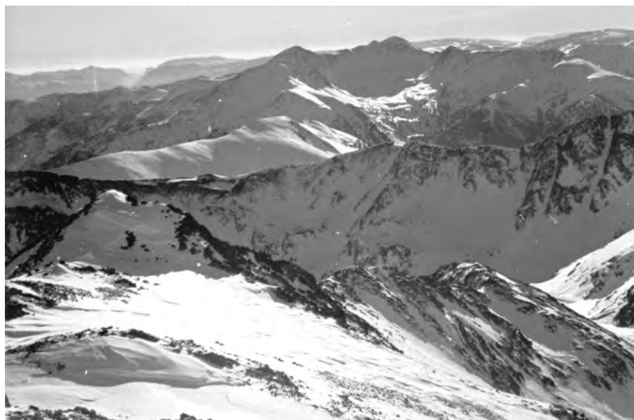
Panoràmica des del Coma Pedrosa, 24 de desembre del 1933