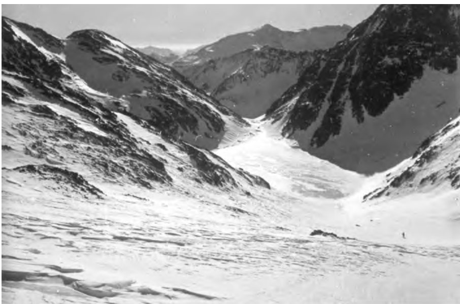
Estany de Coma Pedrosa, 24 de desembre del 1933