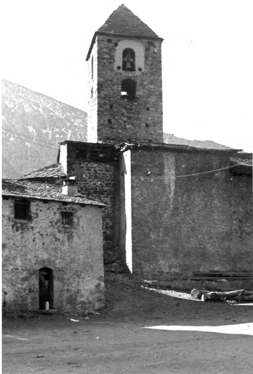
Andorra. L'Església, 2 de setembre del 1928