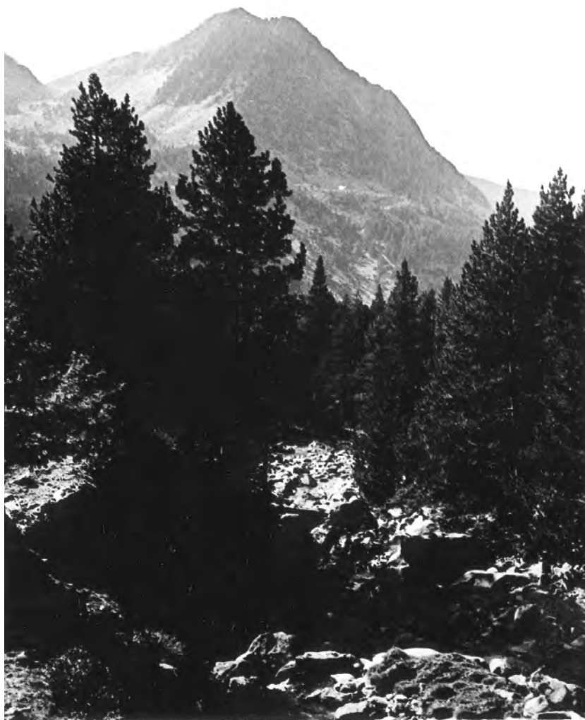
Vall del Madriu. Pic de la Maiana, 3 desembre del 1928