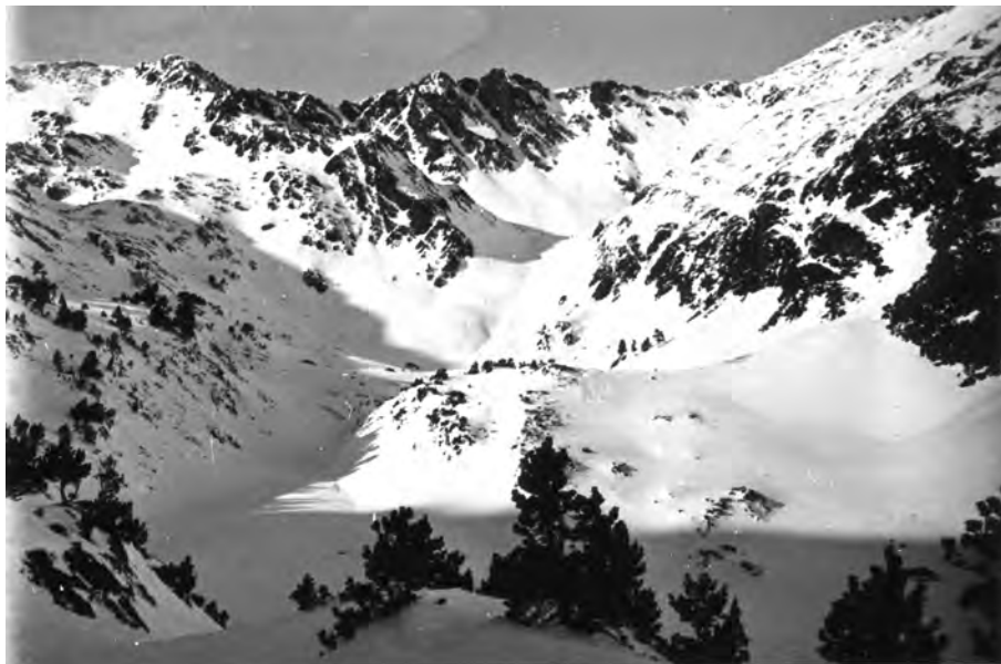
Andorra, vers del Port Vell de Tor, 24 de desembre del 1933