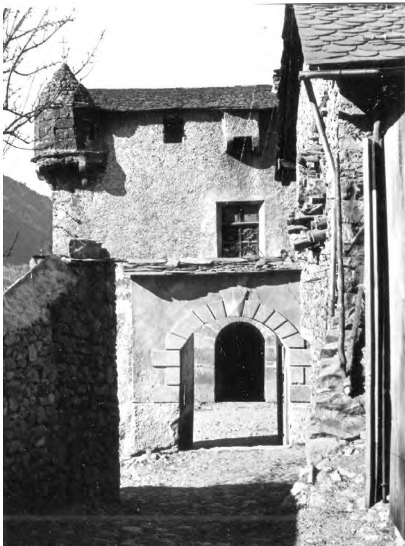
Andorra, la Casa de la Vall, 1 d'abril del 1929