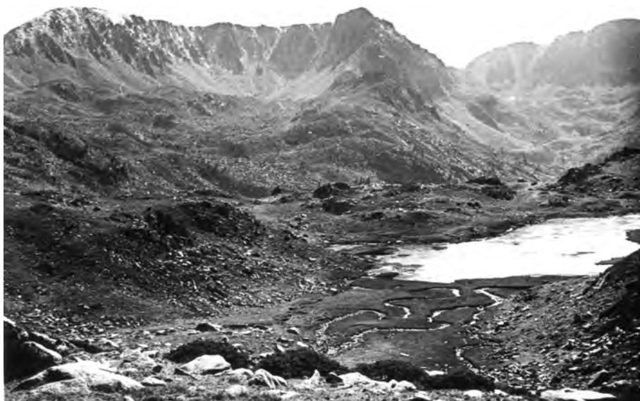
Estany de Vall Civera, 23 de setembre del 1928