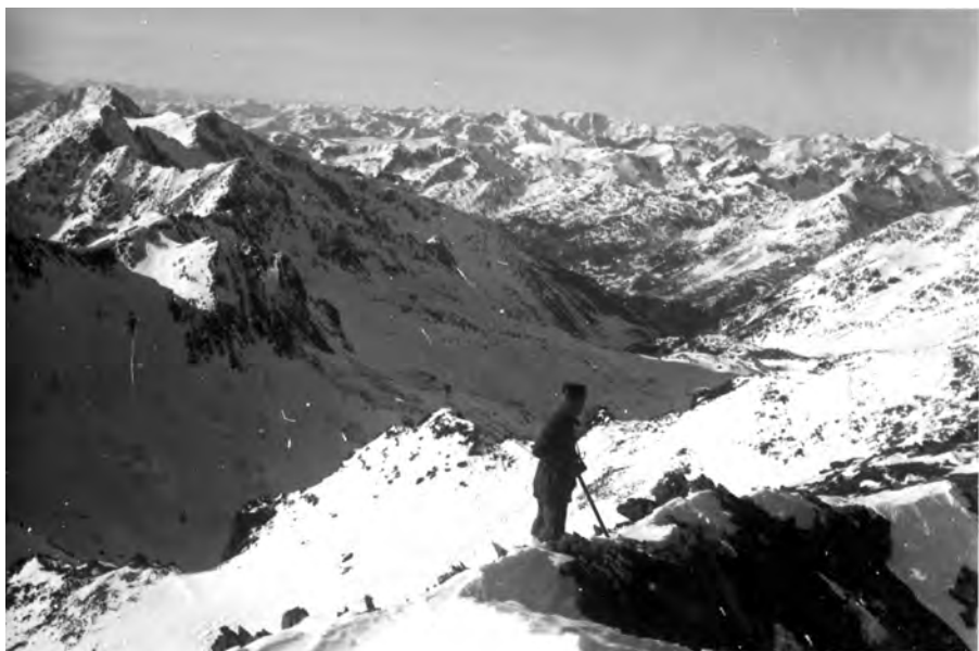
Panoràmica des del Coma Pedrosa, 24 de desembre del 1933