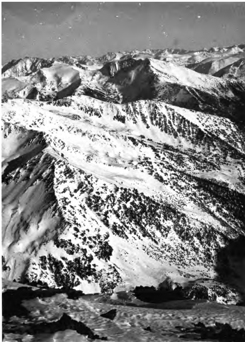
Panoràmica des del Coma Pedrosa, 24 de desembre del 1933