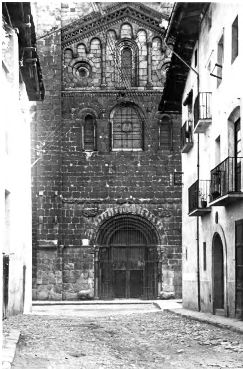
La catedral de la Seu d'Urgell, 24 de desembre del 1928